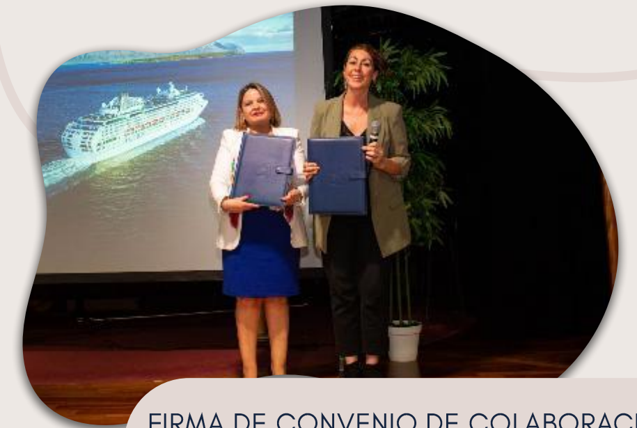
FIRMA DE CONVENIO DE COLABORACIÓN JUNTO A EMILIE MCGLONE, DIRECTORA EJECUTIVA PEACE BOAT US

Durante el mes de enero de 2025, formalizamos nuestro acuerdo de colaboración con el objetivo de vincular a la organización y apoyarla en la organización de sus visitas a Chile, con actividades como: